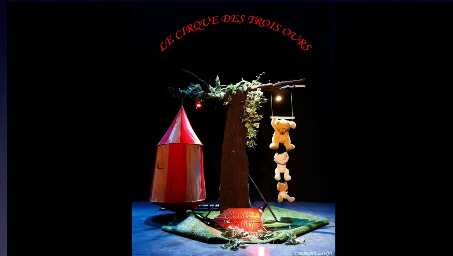
Le cirque des trois ours