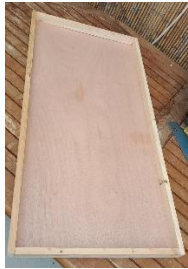
La structure de départ