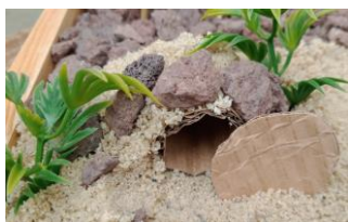
Tombeau de Lazare