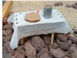
Jeudi Saint la Cène