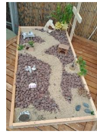
la réalisation finale

Voici les différents endroits clés du chemin :